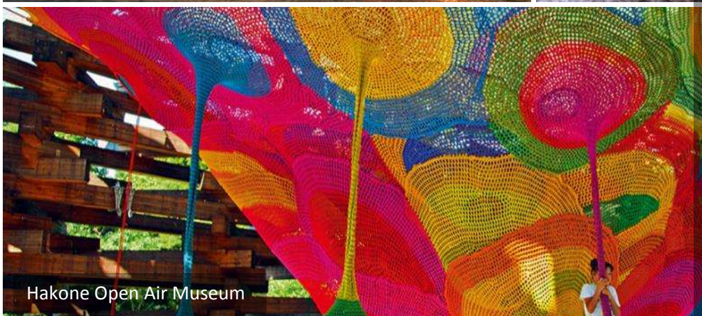
Hakone Open Air Museum