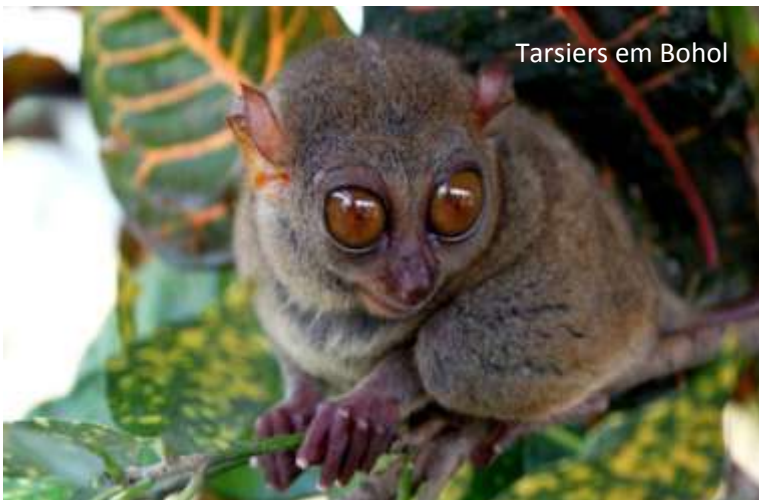
Tarsiers em Bohol