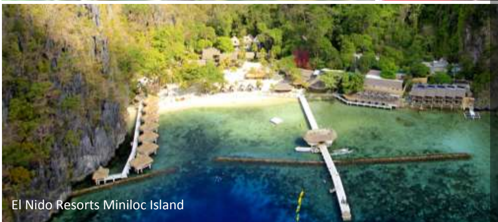
El Nido Resorts Miniloc Island